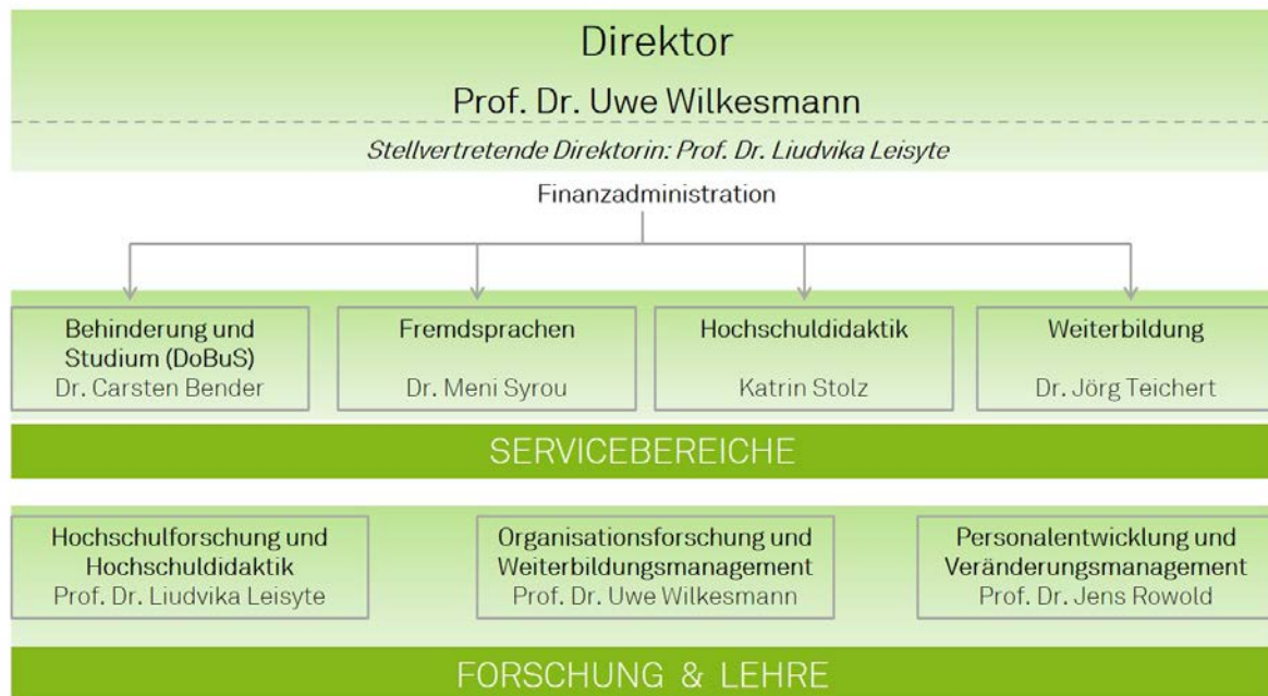
Abb. 1: Die Organisationsstruktur des zhb

Das Zentrum für Hochschulbildung (zhb) blickt auf ein ereignisreiches und spannendes Jahr 2019 zurück. Mit dem vorliegenden Jahresbericht möchten wir über die vielfältigen Aktivitäten und die intensive Arbeit an der TU Dortmund informieren und dazu einladen, sich ein umfassendes Bild vom zhb zu machen. Berichtet wird über neue Entwicklungen in Forschung, Studium und Lehre sowie über Kooperationen und Internationales. Eine umfangreiche Statistik sowie der Drittmittel-Jahresabschluss komplettieren den Bericht. An dieser Stelle danken wir allen zhb-Mitarbeiterinnen und -Mitarbeitern für die hervorragend geleistete Arbeit in Forschung, Lehre und Verwaltung.