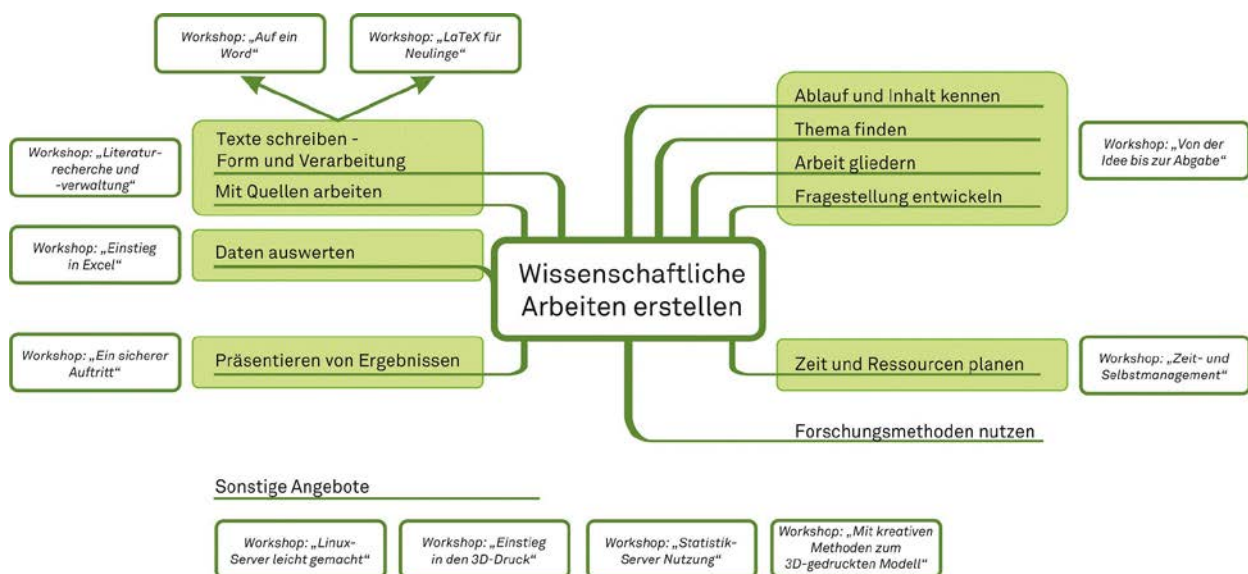
Abb. 2: Beschreibungen der Workshops

Die Veranstaltungen und Beratungs-/Unterstützungsangebote der Forschungswerkstatt wurden auch im Jahr 2019 mit verschiedenen Instrumenten evaluiert. Ergänzend dazu werden seit Oktober 2019 im Rahmen einer Begleitforschung mittels teilstandardisierten Befragungen in den Workshops und Öffnungszeiten sowie leitfadengestützten Interviews mit Teilnehmer*innen und Tutor*innen die Qualität und Wirksamkeit der Forschungswerkstatt-Angebote überprüft.