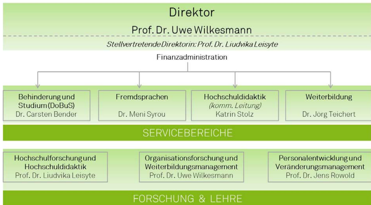
Abb. 1: Die Organisationsstruktur des zhb

Das zhb mit seinen vier Servicebereichen und drei Professuren hat im Jahr 2018 wieder ein breites Spektrum an Veranstaltungen, Dienstleistungen und Forschungsprojekten durchgeführt, die in diesem Jahresbericht dokumentiert werden. Das zhb ist für die wissenschaftliche Weiterbildung und die Fremdsprachenausbildung der TU Dortmund zuständig. Ebenso werden vielfältige Formen hochschuldidaktischen Trainings angeboten sowie eine Individualbetreuung für alle beeinträchtigten Studierenden.